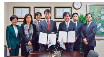
高麗大学校(大韓民国)との部局間交流協定締結

私たちのミッションの一つは、大学院医学院の国際的なプレゼンスを高めることです。海外の大学および研究機関とのパートナーシップを発展させて、最先端の技術と知識を提供し合い、時代のニーズにあった質の高い教育の提供を目指しています。