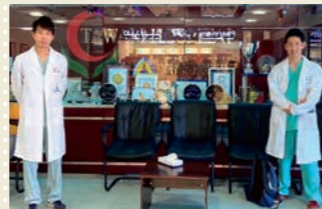
5年次: Al AinのTawam Hospitalにて(UAE)