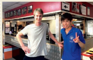
2年次: オークランド大学スカッシュ部での学生交流 (ニュージーランド)

北海道大学は新渡戸カレッジや協定校との交換留学など、海外での経験を積める機会が多く用意されており、医学部の先生方も幅広い支援をしてくださいます。この環境は将来医師として国際的に活躍しようと考えている受験生の方々にとって素晴らしいものだと思います。皆様にお会いできるのを楽しみにしています。