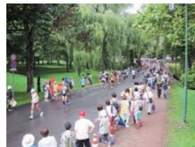
毎年夏に開催される北海道マラソンは、北大構内にもコースに