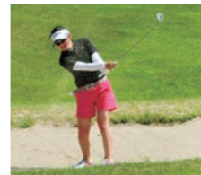
サークル活動に 参加する学生も多い