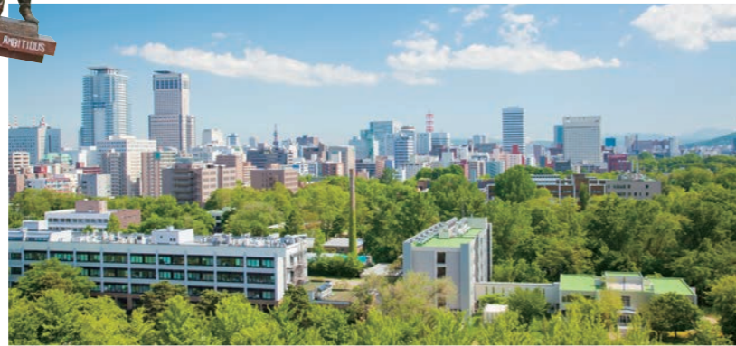
医歯学総合研究棟屋上よりJR札幌駅方面をのぞく