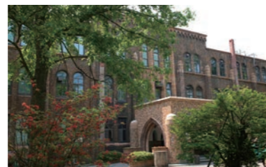
北海道大学総合博物館

これら北大の約140年の歴史を実感できるのが北大総合博物館(2016年7月リニューアルオープン)。ぐるりと巡って北大スピリッツを実感してみてください。