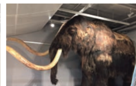
迫力ある原寸大マンモス模型