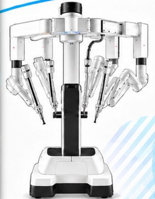
Da Vinci Xi®