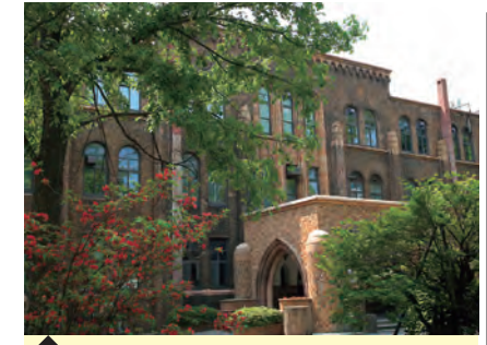
3 理学研究院・理学部本館 (医療基礎物理学分野)