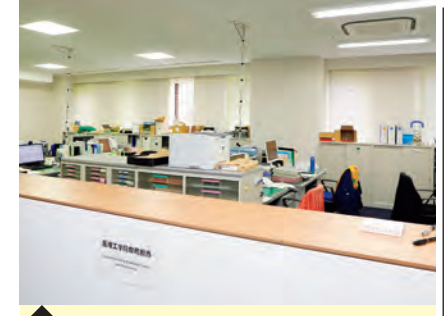
10 医理工学院教務 事務室 (医学研究院・管理棟1階) ※正面玄関入って右手廊下沿い