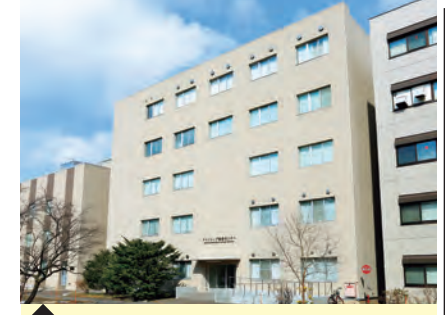
5 アイトープ総合センター・南棟 (応用分子画像科学分野)