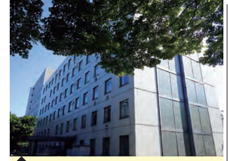
7 歯学研究院・C棟 (分子腫瘍学分野)