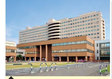
6 北海道大学病院・中央診療棟 (生物指標画像科学分野)