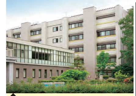
8 医学研究院・中研究棟 (分子・細胞動態計測分野)