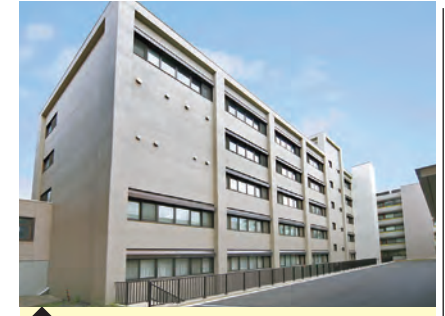
1 医学研究院・東北研究棟 (放射線治療医学分野/臨床医学物理学分野)