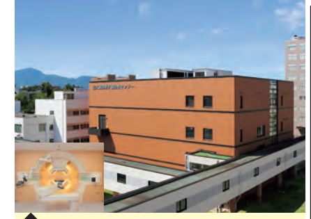
9 北海道大学病院 陽子線治療センター