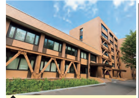
4 保健科学研究院・A棟 (医学物理学分野/医用画像解析学分野)