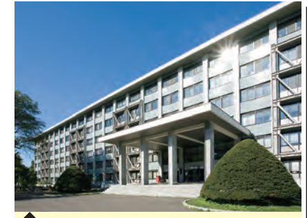
2 工学研究院・Q棟/N棟 (放射線医学物理学分野)