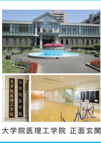
大学院医理工学院 正面玄関