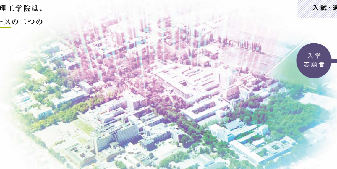
入試・選考の流れ(修士課程・博士後期課程)