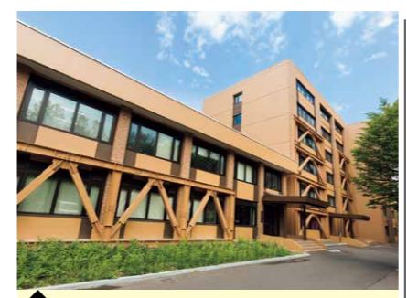
4 保健科学研究院・A棟 (医学物理学分野/医用画像解析学分野)