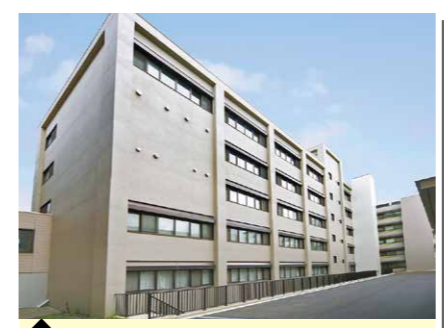
1 医学研究院・東北研究棟 (放射線治療医学分野/臨床医学物理学分野)