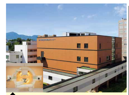
9 北海道大学病院 陽子線治療センター