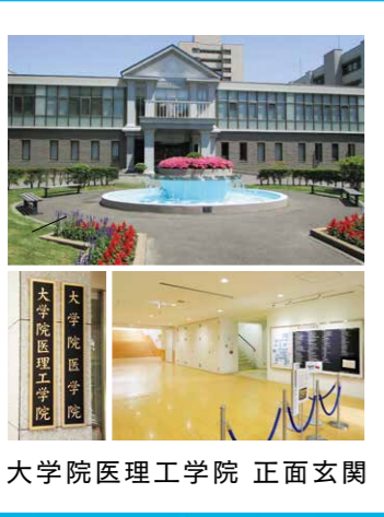
大学院医理工学院 正面玄関