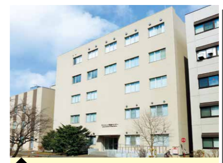
5 アイトープ総合センター・南棟 (応用分子画像科学分野)