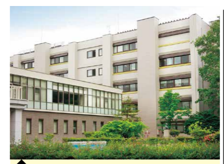
8 医学研究院・中研究棟 (分子・細胞動態計測分野)