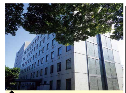
7 歯学研究院・C棟 (分子腫瘍学分野)