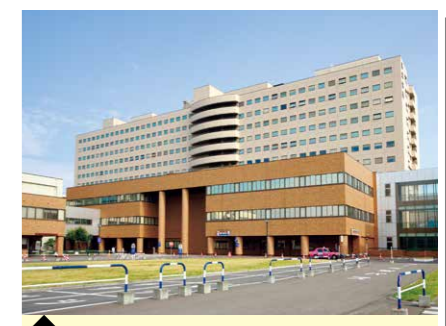
6 北海道大学病院・中央診療棟 (生物指標画像科学分野)