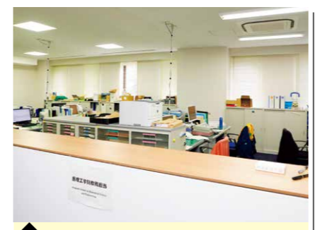
10 医理工学院教務 事務室 (医学研究院・管理棟1階) ※正面玄関入って右手廊下沿い