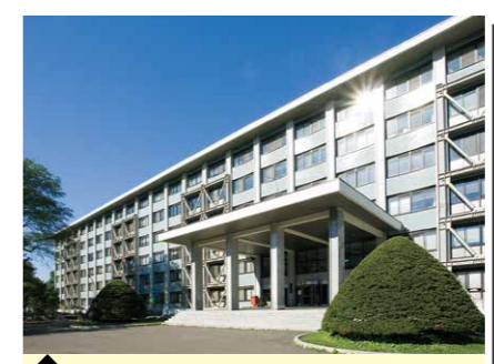
2 工学研究院・Q棟/N棟 (放射線医学物理学分野)