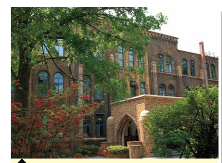
3 理学研究院・理学部本館 (医療基礎物理学分野)