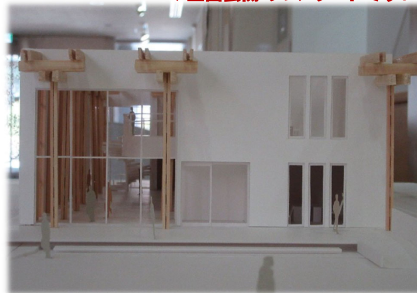
↓正面玄関のファサードです。